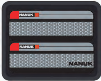
Lid Organizer | Organisateur de couvercle